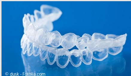
Bleaching-Form aus Kunststoff, in die Sie das Aufhellungs-Gel einfüllen.

Beim Home-Bleaching werden vom Zahnarzt dünne flexible Formen aus einem transparenten Kunststoff hergestellt, die genau auf Ihre Zähne passen (siehe Foto).