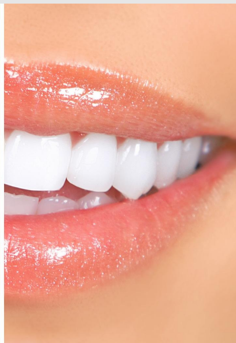
Deutlicher Unterschied: Professionelles Bleaching beim Zahnarzt wirkt!